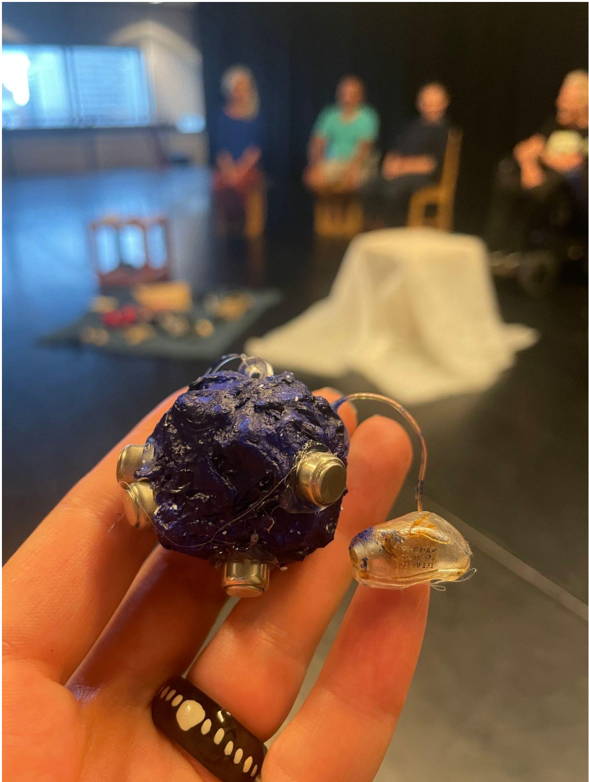
Sculpture prosthétique 05: la planète à prothèses auditives (une main présente une prothèse auditive et piles collées sur une boule bleue, en forme de mini planète) @ Concordia 26 août 2023 Crédit à vérifier:..