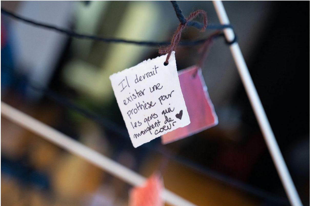
Rêves de prothèses 03: Une prothèse pour les gens qui manquent de cœur. @ Studio 303. 09 juin 2023 by Agustina Isidori.