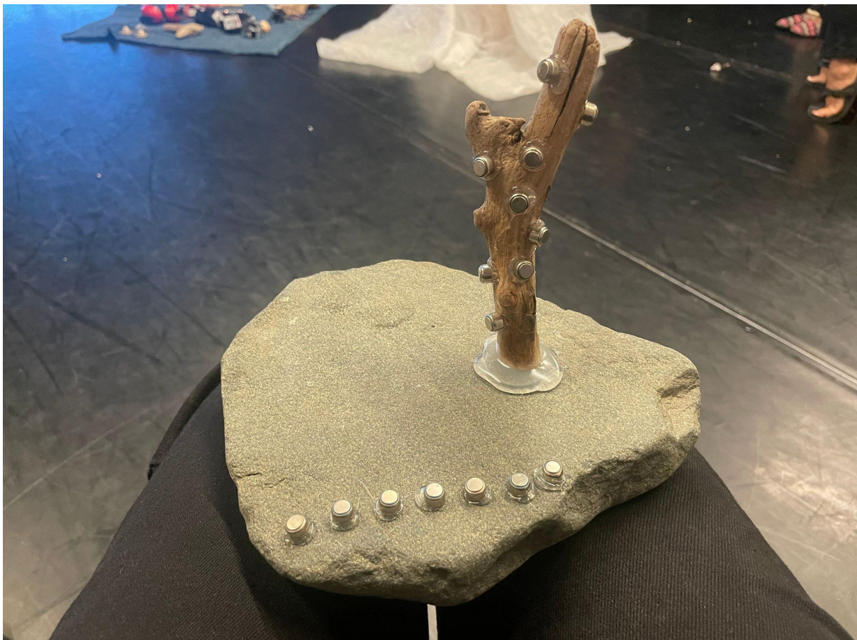
Sculpture prosthétique 04: l'arbre à piles par Véro Leduc (Un morceau de bois en forme d'arbre, garni de piles de prothèses auditives et collé sur un socle de pierre plate) @ Concordia, 26 août 2023 Crédit photo à vérifier.