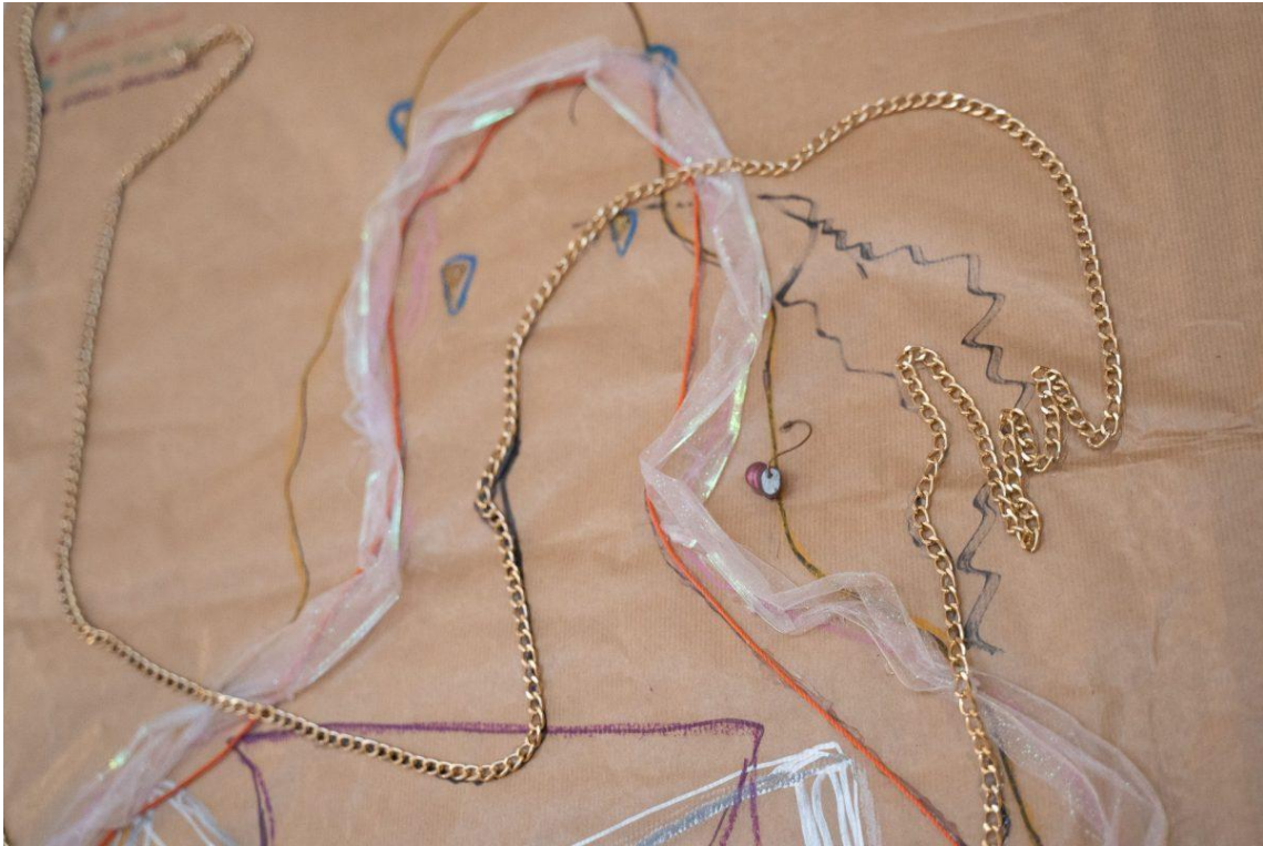
Braille Dessigné 03 : Détail de l'affiche de braille dessinée et des lignes de tissus et de chaînes.) 09 Juin 2023 @ Studio 303 by Agustina Isidori