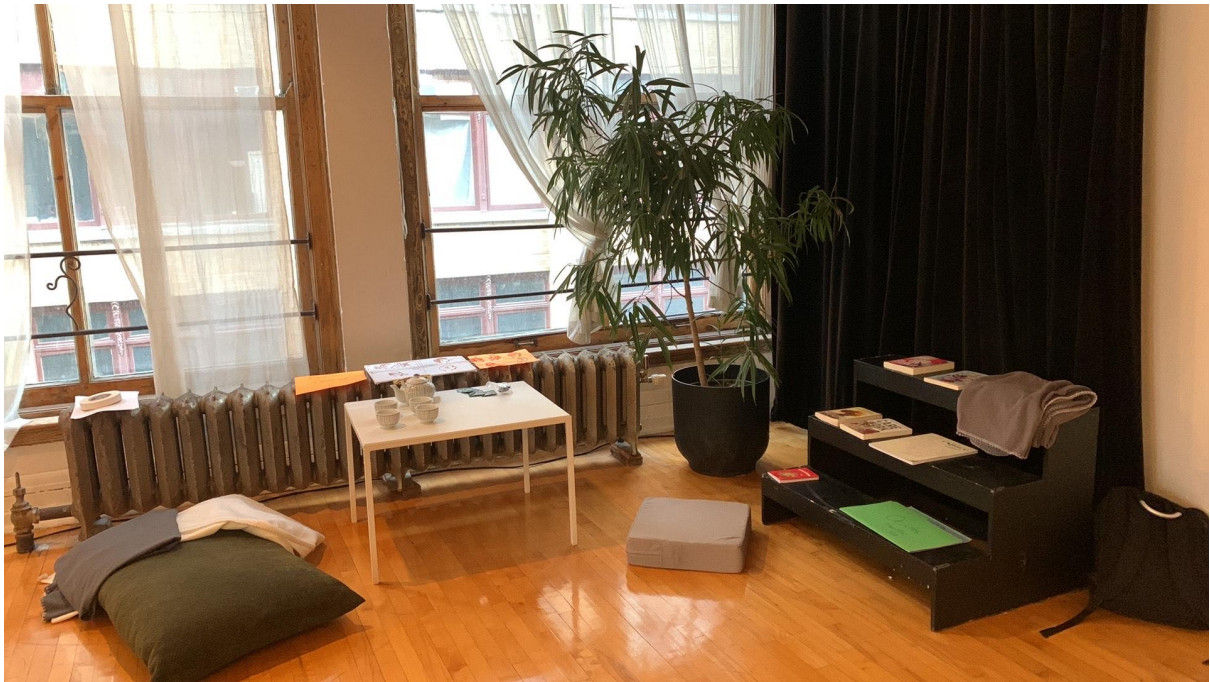
Zone de recharge 03 (La sortie de résidence présentait également une zone de recharge, avec une table à thédes livres, des coussins et de couverture) @ Studio 303 09 Juin 2023.