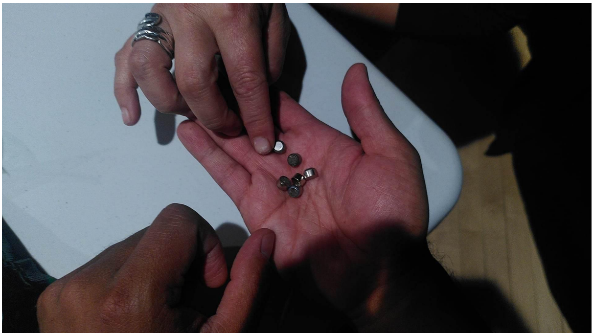
Sculpture prosthétique 02: Piles de prothèses au détail (une main de Véro Leduc triant quelques piles dans la main de Marie Achille) @ AdaX, 20 Avril 2024 by Goldjian. CC BY-NC.