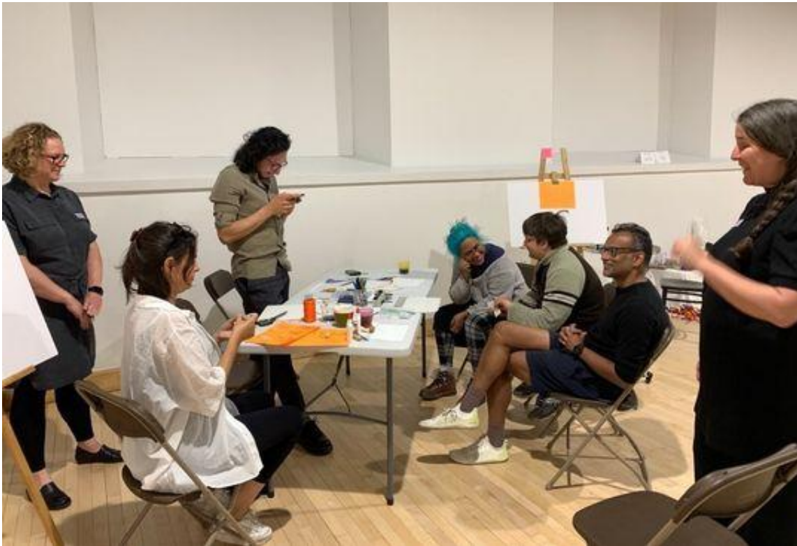
Braille Dessigné 01 : En atelier (Sept personnes partagent des conversations animées autour d'une table jonchée de papiers, de stylets, de dymo braille et d'ardoise braille.) @ M-A-I 26 Mai 2023 by Marie Achille