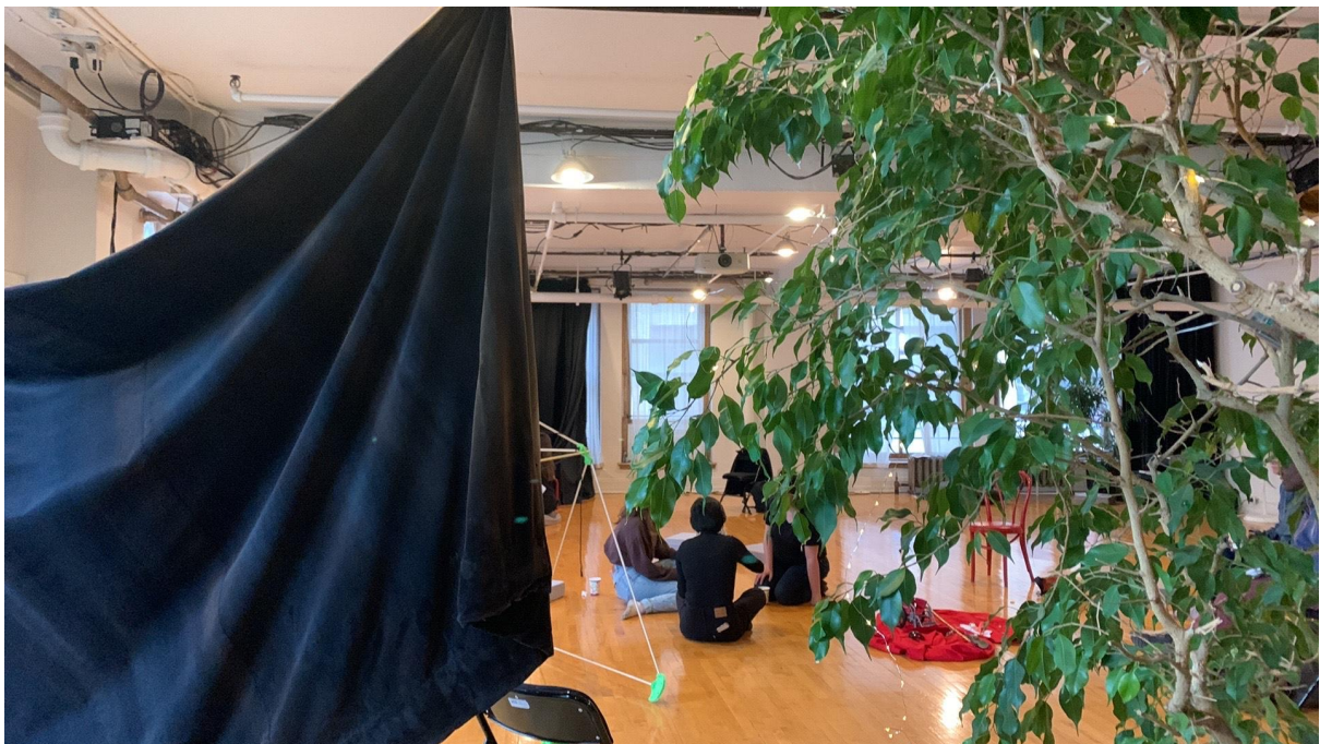
Zone de recharge 04 (Une des principes structurant ayant émergé du hackfest et reproduite à la sortie de résidence est l'importance des zones de tampon acoustiques. Voici une vue du reste de l'espace depuis l'une de ces zones, construite avec un rideau de théâtre) @ Studio 303 09 Juin 2023.