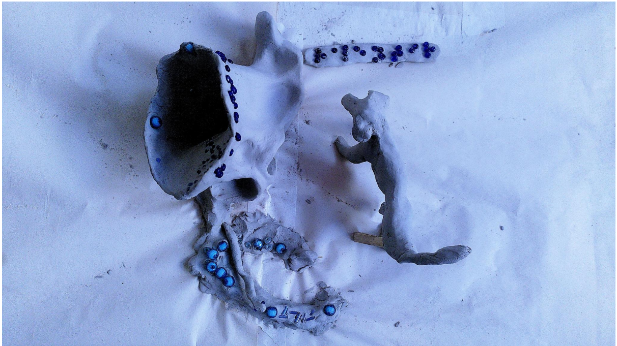
Sculpture prosthétique 01: Sculpture à trois réalisée en argile et perles par Carlos Parra, Véro Leduc et Goldjian (chien prosthétique, maison-oreille, serpent de cours, jardin intérieur et rivière adjacente. Avec le mot RALENTIR écrit en braille.) @ AdaX, 20 Avril 2024 by Goldjian CC BY-NC.