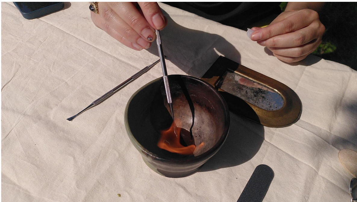
Dentisterie Collective 01: Fabrication de prothèse dentaire (au-dessus d'un creuse en terre, une personne tient une petite prothèse dentaire dans une main et un outil en métal dans l'autre, qui est passé dans de l'alcool enflammé. Il y a un miroir déposé sur nappe blanche) @ M-A-I, 26 Mai 2023, by goldjian. CC-BY-SA