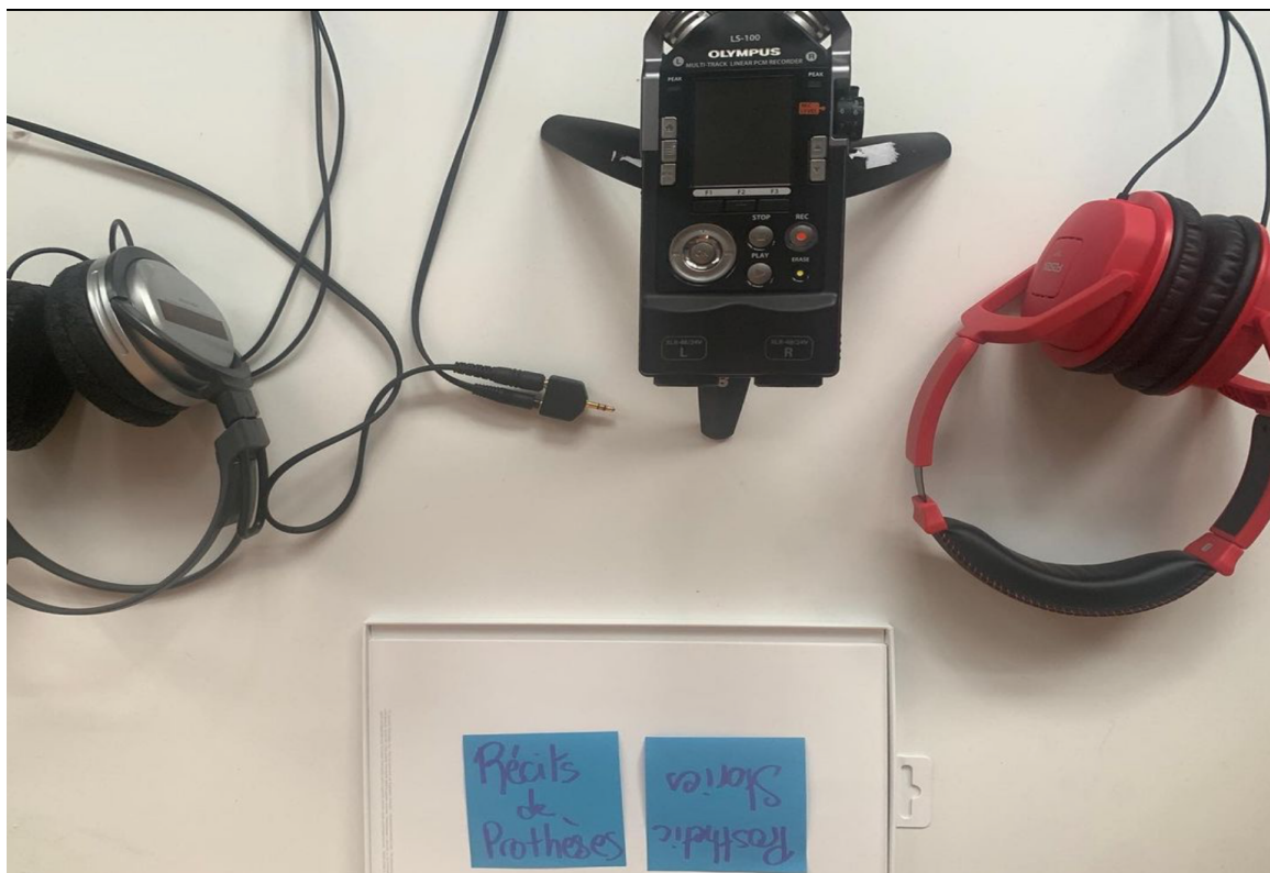
Récit de prothèses 01: La fameuse LS100 et deux écouteurs. (L'enregistreuse Olympus LS 100 est la seule enregistreuse qui offre une audio description et permet ainsi aux utilisateurs aveugles de l'utiliser) @ AdaX, 20 Avril 2024 by Goldjian. CC-BY-NC